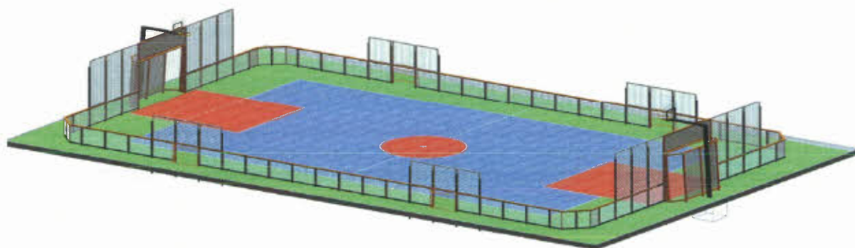
Uitwerking Multicourt Haghoekspark